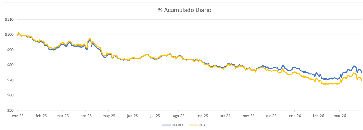
ERROR DE REPLICIA